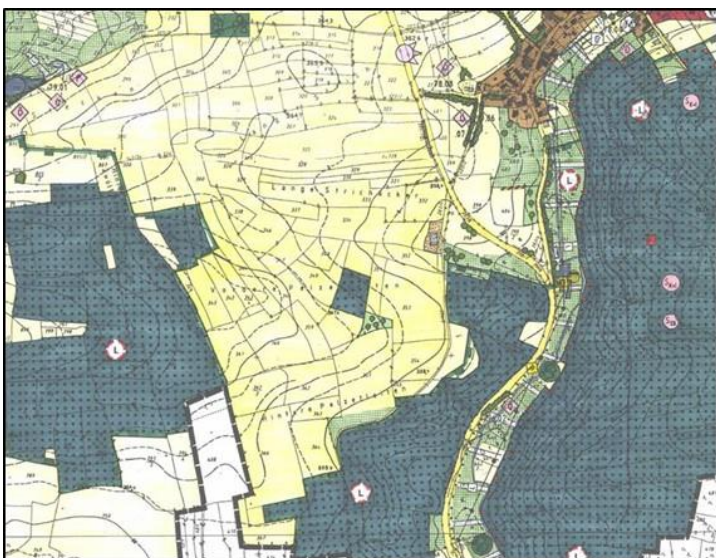
Abbildung 1: Ausschnitt aus dem Flächennutzungsplan der Marktgemeinde Cadolzburg

Die bauplanungsrechtliche Zulässigkeit von PV-Freiflächenanlagen, die wie vorliegend im planungsrechtlichen Außenbereich errichtet werden sollen, erfordert daher generell eine gemeindliche Bauleitplanung, ergo eine Vorbereitung durch eine Anpassung der Darstellungen des Flächennutzungsplanes über ein Änderungsverfahren sowie die Aufstellung eines Bebauungsplanes.