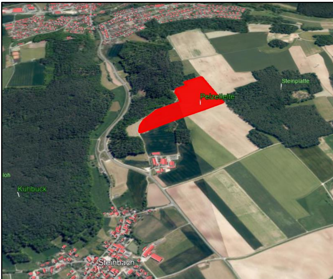
Abbildung 7: Lage und Topographie der Anlage im Raum

Von Steinbach und Ammerndorf ist aufgrund der Bewaldung und der hügeligen Topographie von keiner Einsehbarkeit auszugehen. Trotz der erhöhten Lage von der Cadolzburg ist die Sichtbeziehung zur Freiflächenphotovoltaikanlage ebenfalls als maximal geringfügig zu bewerten. Zusätzlich wird der nördliche Teil des Plangebiets Eingegrünt, da der Einbindung in die Landschaft eine besondere Bedeutung zukommt. Insbesondere die Lage zwischen zwei Waldflächen trägt zur Verminderung der Fernwirkung der Anlage bei, da die Wälder bei Betrachtung der Anlage für einen natürlichen Rahmen sorgen. Dadurch wird die Anlage als weniger störend empfunden, da in der Fernwirkung, insbesondere von nördlicher Richtung (Cadolzburg) aus, die Horizontlinie des Waldes überwiegt. Darüber hinaus wird zum Schutz des Landschaftsbildes das Vorhabengebiet nach Nordosten eingegrünt. Durch eine Eingrünung wird eine potenzielle Fernwirkung zusätzlich vermindert werden.